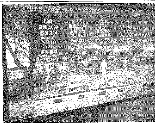
開発中の「リアルフォーカス」画面

【南大阪】日昌電気制御（大阪府泉佐野市、神藤昌平社長）は、3次元アニメーションによるゲームのような演出で、現場の生産性向上につなげる可視化システム「RealF ocus（リアルフォーカス）」の展開を始める。第1弾として、繰り返し作業の進捗 状況を可視化して、作業者同士に競わせるシステムを完成、23日に発売する。2023年 度に付帯工事費を含め、1億円の売り上げを狙う。 発売するシステムは タイムで実績データを 作業の進捗に合わせて 作業者に、繰り返し作 取得し、ゲーム演出を 動き、成長していく姿 業を飽きさせず、モチ 用いて可視化。本体価 を表示する。一部デー ーション高く続けて 格は税抜き110万円 からの想定する。 専用のディスプレイ 業環境、目的に応じて 設定が可能。同一画面 エビックゲームスから