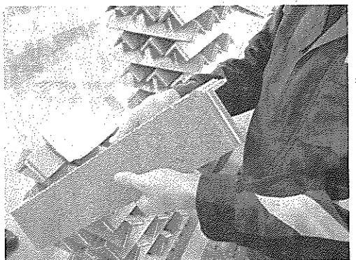
大日運輸が 製造するコー ナー材